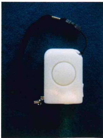
(社)電池工業会規格適合品